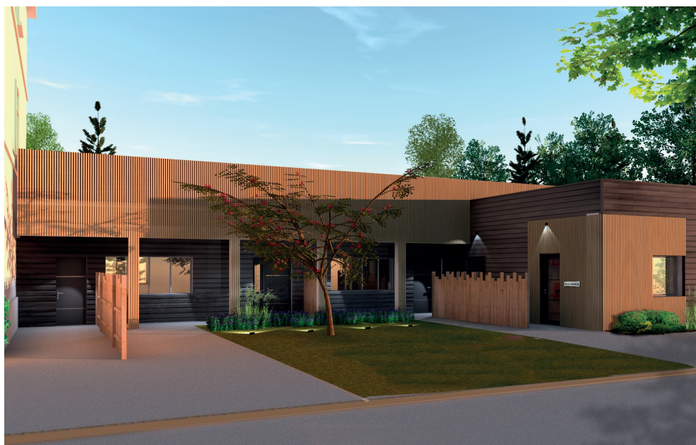
Vues 3D de la résidence d'artiste de l'ECPAD.

actions-culturelles@ecpad.fr / 01 49 60 59 96 – 01 49 60 52 70